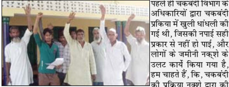
पहले ही चकबंदी विभाग के अधिकारियों द्वारा चकबंदी प्रकिया में खुली धांधली की गई थी, जिसकी नमाई सही प्रकार से नहीं हो पाई, और लोगों के जमीनी नक्शों के उलट कार्य किया गया है, हम चाहते हैं, कि, चकबंदी की प्रकिया नक्शों द्वारा की जानी चाहिए, वरना हम इसकी शिकायत उच्च अधिकारियों से करेंगे।

मृदापांडे (शाह टाइम्स संवाददाता)। ग्राम पंचायत पेपेटपुर जंपद मुरादाबाद थाना मृदापांडे में ग्रामीणों द्वारा लेखपाल के खिलाफ जमीनी नमाई में धांधली करने को लेकर के विरोध जताया है, उनका कहना है, के, अभी कुछ महीने